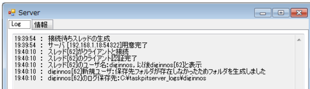
図 4.3 改ざんのないクライアントへの起動許可