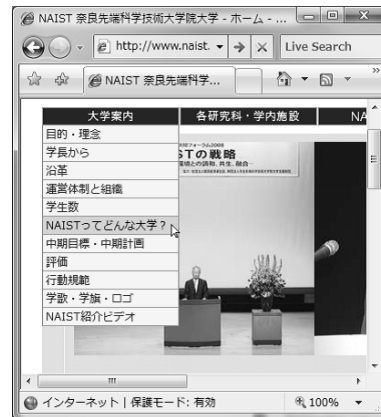
(b) ドロップダウンメニューが開いた状態