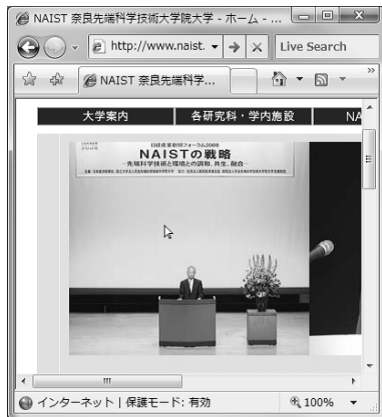
(a) ドロップダウンメニューが閉じた状態