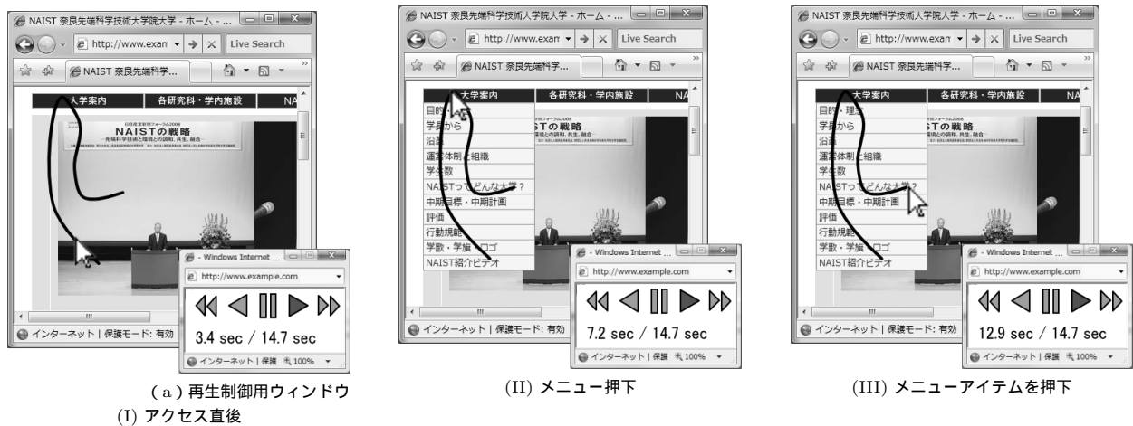
図 3 ユーザ行動情報表示 Webjig クライアントの動作イメージ

とが可能であるため、ユーザが Web ページ内のどこを見ているか、または見ていないかの判断を支援する。さらに、行動を時系列で表示する機能も備える。